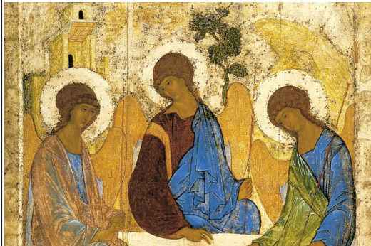
Icona della Santissima Trinità di Andrej Rublëv