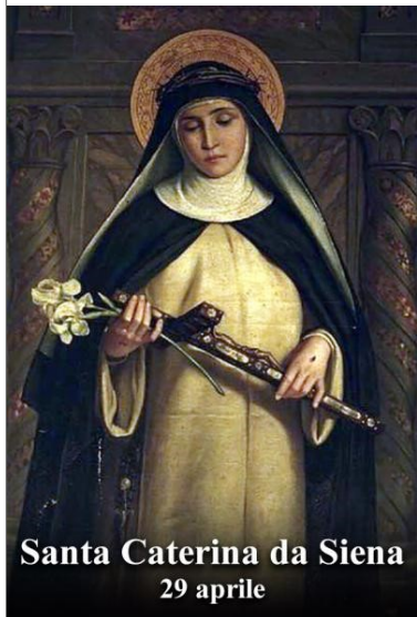
Santa Caterina da Siena 29 aprile

Santa Caterina, angelo della Chiesa e gloria d'Italia, sii benedetta. Tu hai amato le anime redente dal tuo divino Sposo: come lui hai sofferto e pianto per la patria e hai offerto la tua vita per la Chiesa e i fratelli. Quando la peste mieteva vittime e quando prevaleva la discordia tu passavi come angelo di carità e di pace. Con forza hai combattuto il disordine morale scuotendo e chiamando a raccolta tutti gli uomini di buona volontà. In punto di morte hai invocato sulla Chiesa e sull'Italia il Sangue prezioso dell'Agnello. Santa Caterina, nostra sorella e patrona, vinci l'errore, custodisci la fede, infiamma e raduna tutti noi intorno al dolce Cristo in terra. La nostra patria terrena, benedetta da Dio, eletta da Cristo, sia vera immagine di quella celeste nella pace, nella carità e nella lode alla Trinità. Fai che la Chiesa si estenda nel mondo quanto il Salvatore ha desiderato, e fai che il Papa sia amato e cercato come padre e consigliere di tutti. Aiuta ognuno di noi a essere sempre fedele ai doveri di cittadini e