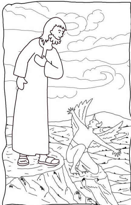
Gesù tentato nel deserto - da colorare

Partenza E. Lussu (parcheggio), E. Lussu, Sardegna, N. Paganini, Cagliari, Lao Silesu, Sardegna, Dalla Chiesa, Mons. Cherchi, Nostra Signora, Assemini, Marghinotti, Emanuela Loi ( Chiusura )